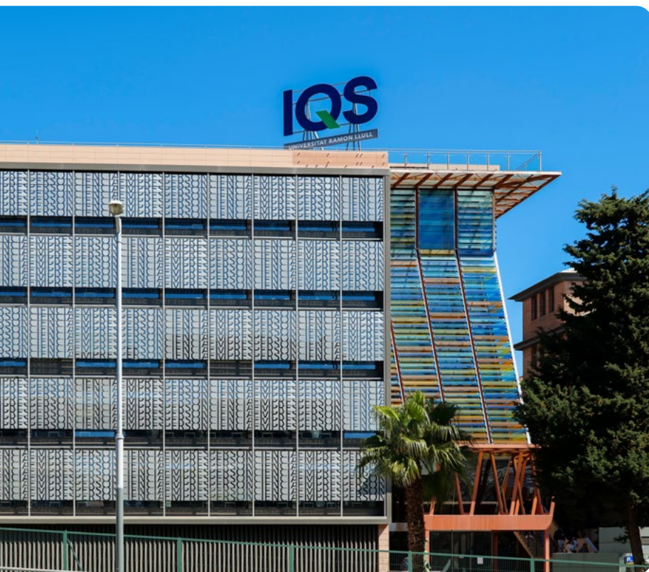
Edificio School of Management